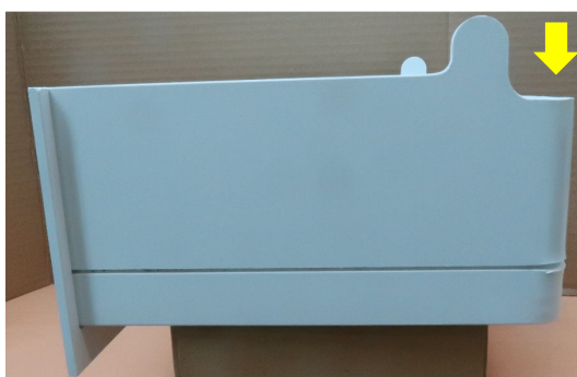
図4 正規の形状の引き出し